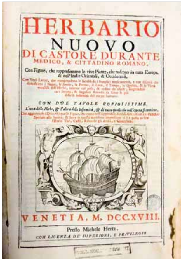
Sopra e nella pagina accanto: Castore Durante, Herbario nuovo , Venezia, Michele Hertz, 1718. Il volume veniva usato anche come raccogliitore di campioni vegetali

vono; purtroppo ora ne rimangono solo sparuti relitti. Ma in occasione dell'ultima 'notte nazionale del liceo classico' un'alunna che collaborava all'allestimento di una piccola mostra si è trovata fra le mani il biglietto d'invito a una festa indetta per il luglio del 1695, dimenticato tra le pagine di una bizzarra compilazione cinquecentesca, la Piazza universale di tutte le professioni del mondo di Tommaso Garzoni (Venezia, 1585). Ben più sorprendente avventura capitò a quell'altra alunna che nel 1990 rinvenne in mezzo al primo tomo delle Antichità italiane di Ludovico Antonio Muratori (Monaco, 1774) un paio di occhiali di fattura tipicamente settecentesca, perfettamente integri, che sono tuttora conservati nella biblioteca del liceo. Circola da allora fra gli studenti